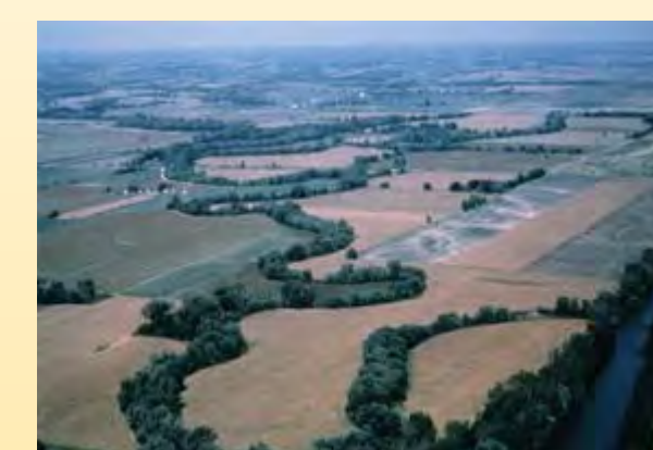
siepi di tipo produttivo