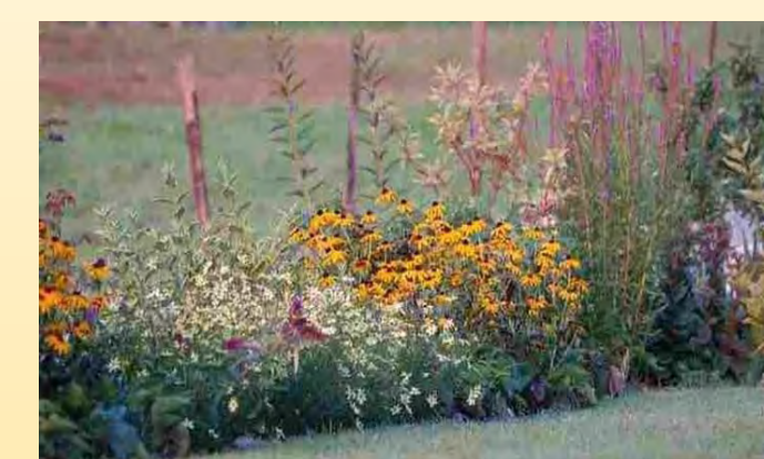
siepi "contro la deriva ", che frenano il moto in atmosfera di prodotti fitosanitari